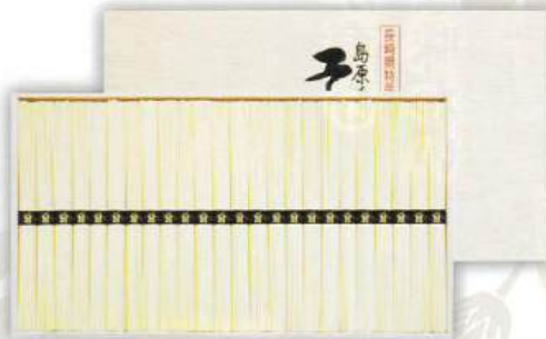
9053-020 島原手延そうめん AW-30 10

●箱:220×272×28mm●手延そうめん50g×16束●のし:A4●JPN(長崎県) (H85-9020053)回【小麦】