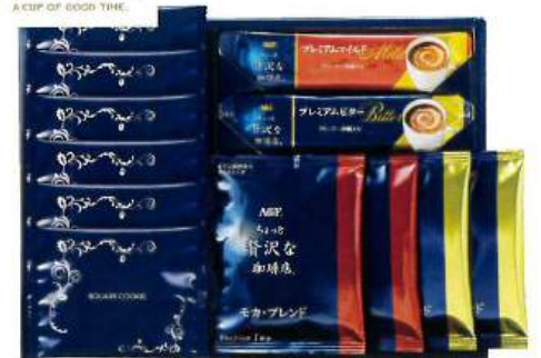
9049-097 AGF クッキータイムセット ACBO 40

★本体 2,000円 ▶ 本体 1,960円 (税込 2,160円) (税込 2,117円)