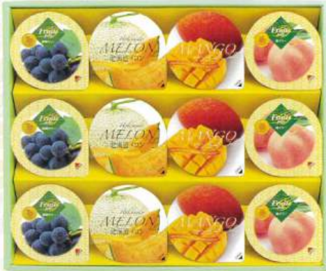
9049-014 サマーギフトゼリー TKK-20N 12

★本体 2,000円 ▶ 本体 1,800円 (税込 2,160円) (税込 1,944円)