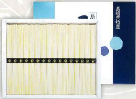
9053-010 島原手延そうめん A-2DS 16

★本体 2,000円 ▶ 本体 1,800円 (税込 2,160円) (税込 1,944円)