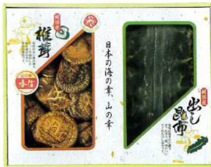
9049-040 国内産 原木香信椎茸・昆布詰合せ TSK-20N4 15

●箱:250×310×60mm●Sバスマット●アクリル100%(抗菌防臭・吸水速乾・すべりにくい加工)●のし:A3●JPN (H75-7015015)D