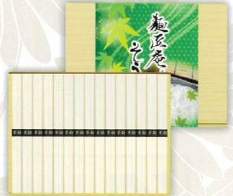
9053-032 麵匠庵そうめん SO-20 16

●木箱:207×372×30mm●手延そうめん50g×24束●のし:半紙●JPN(長崎県) (H85-9020053)回【小麦】