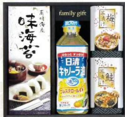
9049-085 日清オイル&味付のリセット NN-20S 20

●箱:245×265×35mm●スープ(野菜なまご×2・オニオン×2・きのこ・ふかひれ)、クルトン(5g×2袋)●のし:切手●JPN※包装済 (H92-8720241)D 【乳成分:小麦】