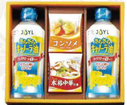
9049-061 味の素 オイルギフト L-B 10

●箱:263×375×45mm●国内産原木香信椎茸30g、国内産出し昆布50g●のし:A4●JPN (H75-7020500)D