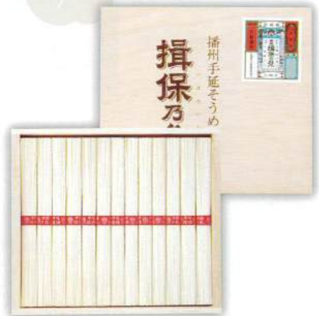
9053-044 揖保乃糸 上級品 J-20 14

●箱:205×267×25mm●そうめん50g×15束●のし:A4●JPN(兵庫県) (H77-7220318)回【小麦】