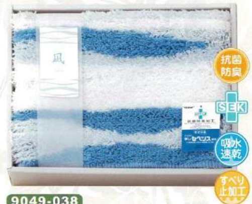
9049-038 凧 Sバスマット 094455 24

本体 2,000円 ▶ 本体 1,600円 (税込 2,200円) (税込 1,760円)