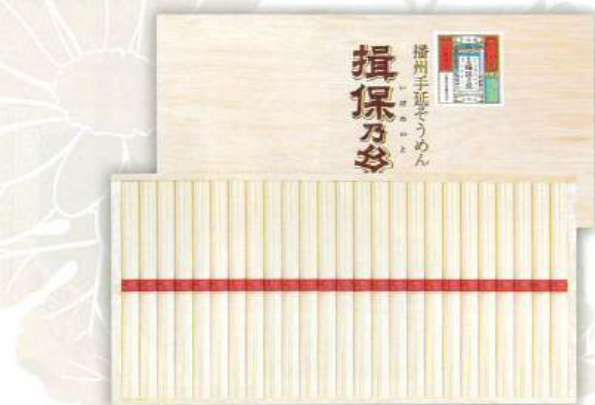
9053-070 揖保乃糸 上級品 J-40 8

●木箱:205×320×30mm●手延そうめん50g×19束●のし:A4●JPN(兵庫県) (H92-8720318)回【小麦】