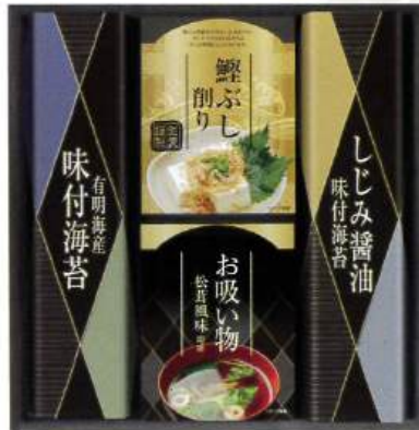
9049-026 和の食卓詰合せ SV-20 20

●箱:270×320×35mm●北海道×ロンゼリー・マンゴーゼリー・桃ゼリー・葡萄ゼリー 52g×各3●のし:A4●JPN※包装済 (H90-8520331)D 【乳成分】