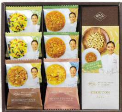
9049-073 秋元さくら監修 フリーズドライスープギフト AKI-C 20

●箱:220×255×65mm●JOYLオイルさらさらキャノーラ油350g×2、コンソメ顆粒(5g×2)、本格中華の素(5g×3)●のし:A4●JPN (H92-8720248)D