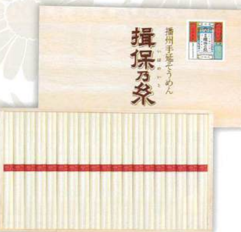
9053-068 揖保乃糸 上級品 J-30 8

●木箱:208×290×37mm●手延そうめん50g×16束●のし:A4●JPN(兵庫県) (H92-8720318)回【小麦】