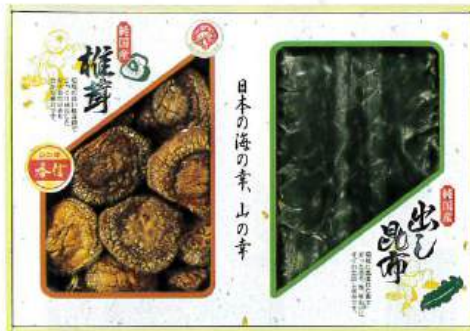
9049-050 国内産 原木香信椎茸・昆布詰合せ TSK-30N4 10

●箱:257×330×36mm●国内産原木香信椎茸20g、国内産出し昆布25g●のし:A4●JPN (H75-7020500)D