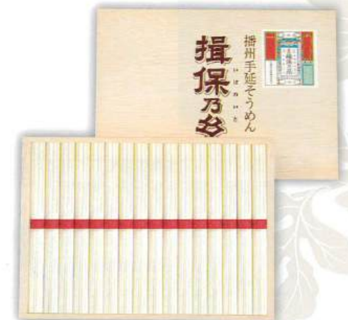
9053-056 揖保乃糸 上級品 J-25 10

●木箱:210×237×33mm●手延そうめん50g×13束●のし:A4●JPN(兵庫県) (H92-8720318)回【小麦】